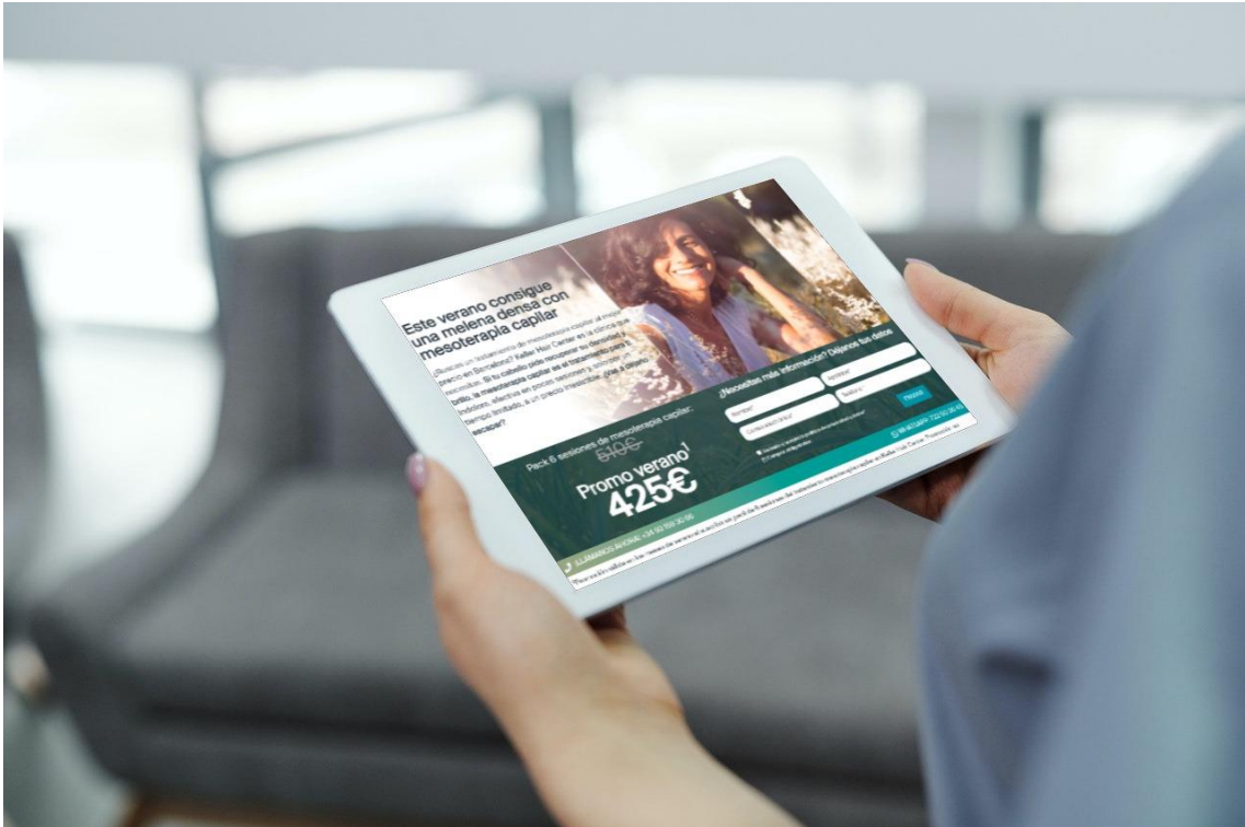
La campaña busca eliminar mitos y barreras que impidan acceder a los tratamientos capilares.